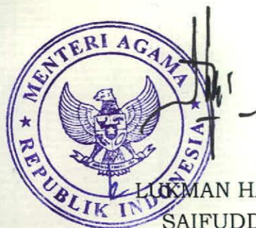
LUKMAN HAKIM SAIFUDDIN

MENTERI PENDAYAGUNAAN APARATUR NEGARA DAN REFORMASI BIROKRASI REPUBLIK INDONESIA,